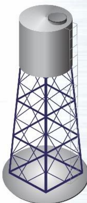
Reservatório para água TORRE DE FERRO