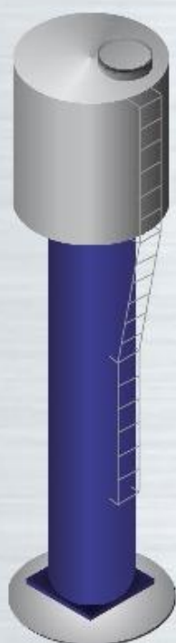
Reservatório para água TIPO TAÇA